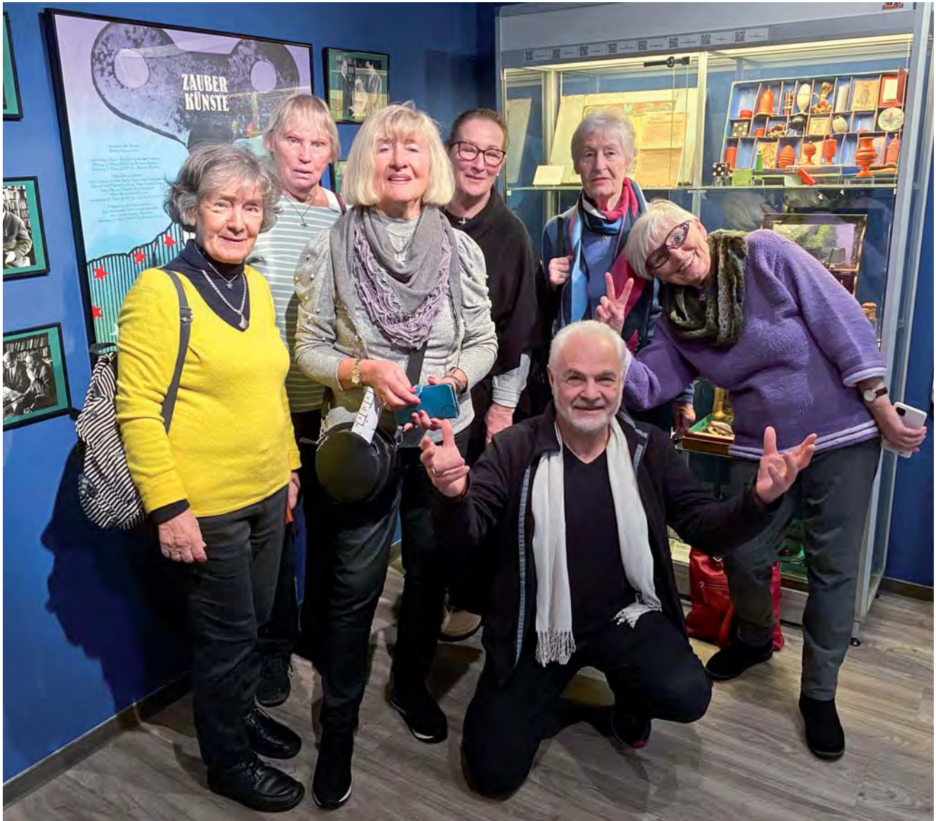
Auch „kleinere“ Gruppen (ab 6 Personen) haben Freude an einer Führung durch das Museum Bellachini