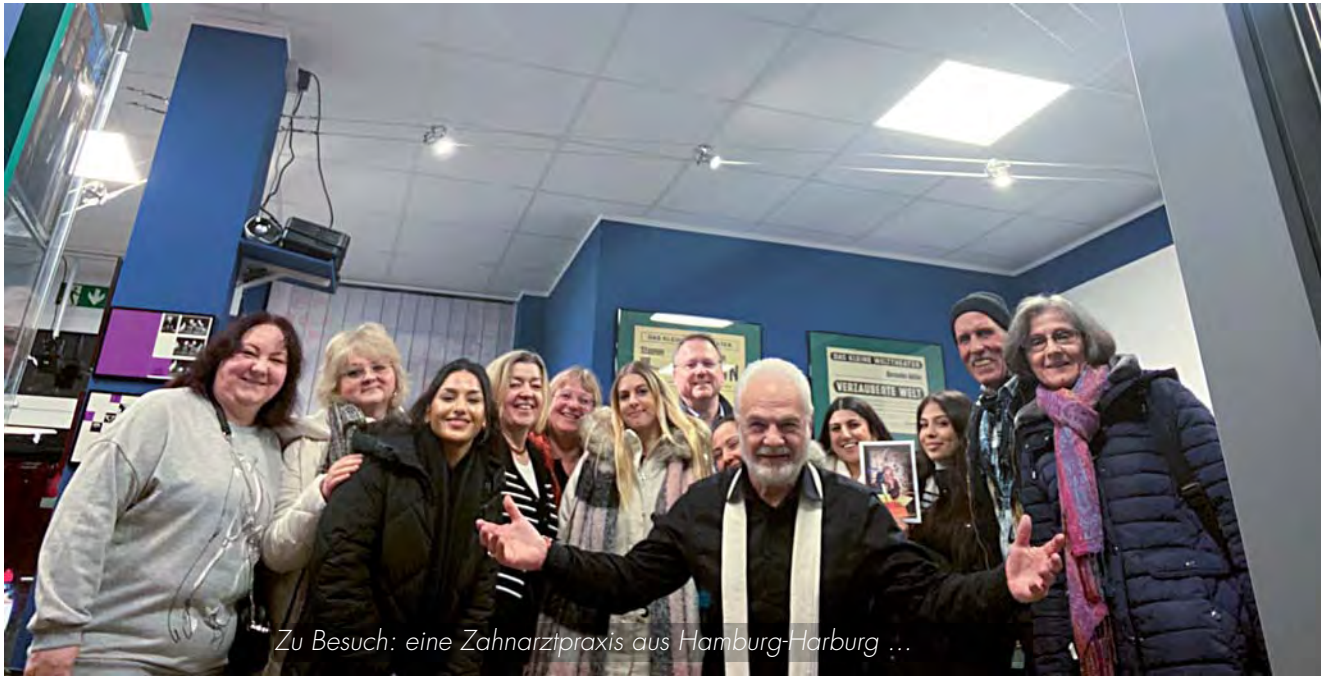
Zu Besuch: eine Zahnarztpraxis aus Hamburg-Harburg ...