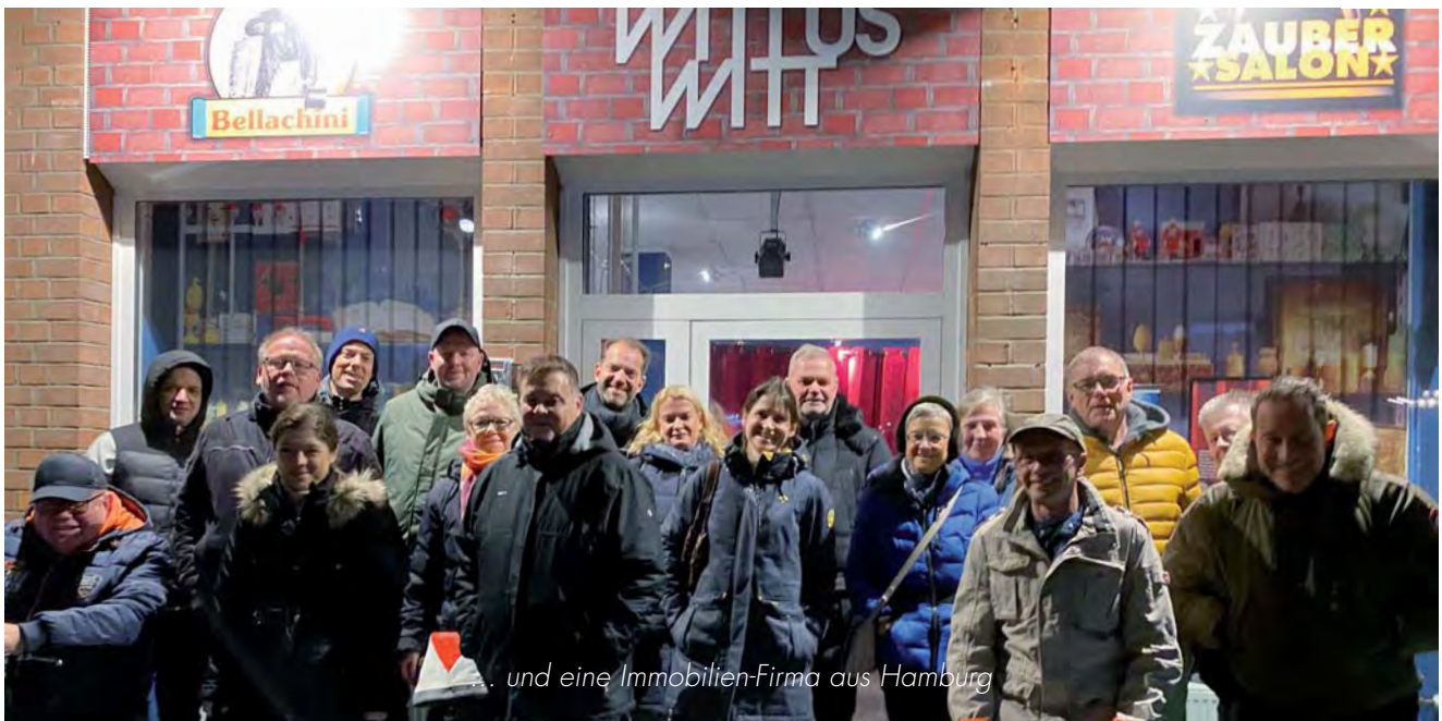
... und eine Immobilien-Firma aus Hamburg